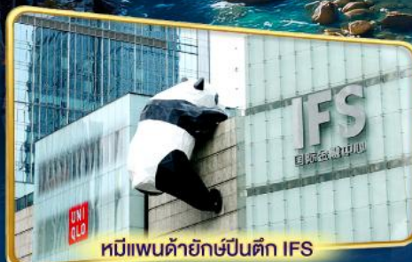
หมีแพนด้ายักษ์ปีนตึก IFS