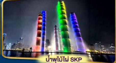
น้ำพุไม้ไฟ SKP