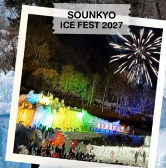
SOUNKYO ICE FEST 2027