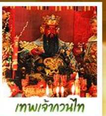
เทพเจ้ากวนไท