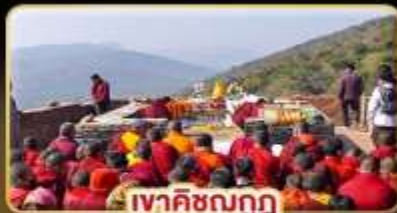
เทศกาลมฤก