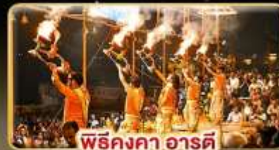
พิธีคงคา อาร์ตี