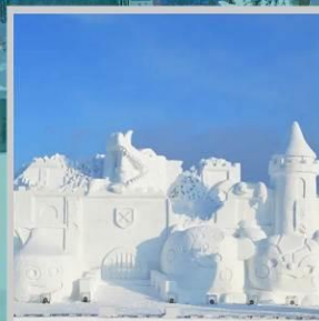
“ASAHIKAWA SNOW FEST”