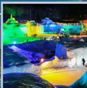
“SOUNKYO ICE FEST”