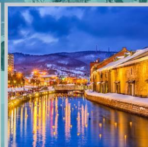
“OTARU CANAL FEST”