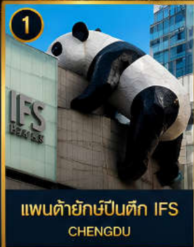
1 แพนด้ายักษ์ป็นตึก IFS CHENGDU