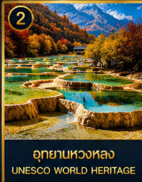
2 อุทยานหวงหลง UNESCO WORLD HERITAGE