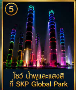
5 โชว์ น้ำพุและแสงสี ที่ SKP Global Park