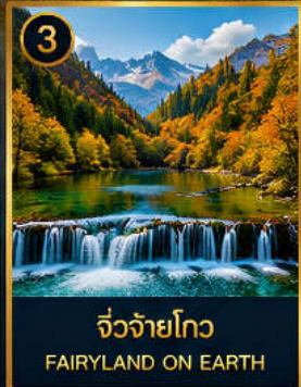
3 จี๋จ้ายโกว FAIRYLAND ON EARTH