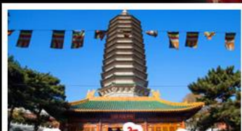
วัดพระเขี้ยวแก้ว