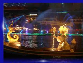
ชมโชว์เวนิสจำลอง แกรนด์เวิลด์