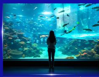
อควาเรียมยักษ์รูปเต่า