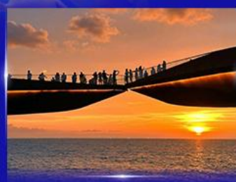
สะพานจูบ Sunset Town