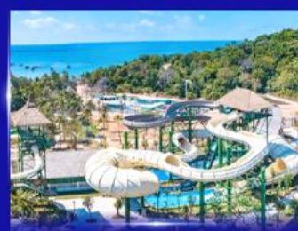
สวนสนุก Sun world Hon thom