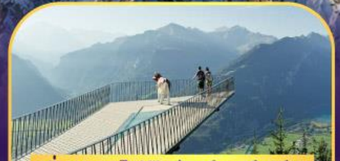
นั่งรถไฟสู่ชาร์เตอร์ดูล์ม