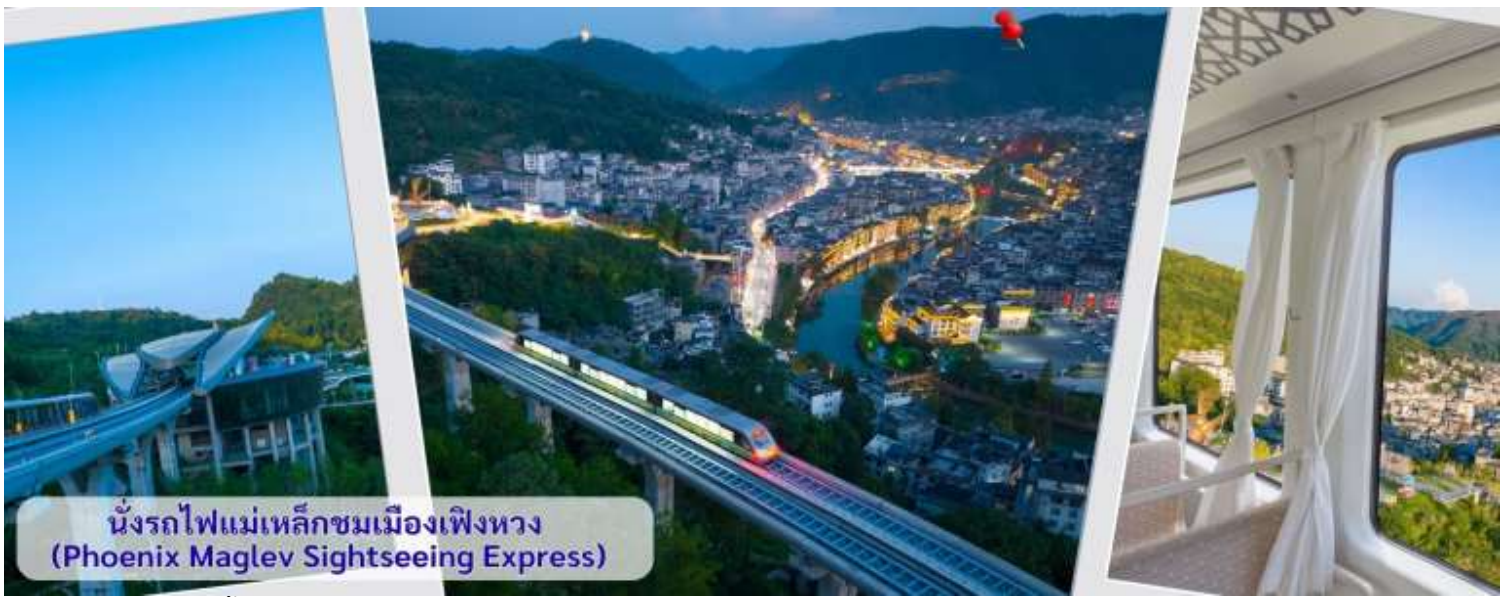
นั่งรถไฟแม่เหล็กชมเมืองเฟิงหวง (Phoenix Maglev Sightseeing Express)

จากนั้นนำทุกท่าน เดินถนนโบราณ Feng Hueng Ancient Town ที่ถนนช้อปปิ้ง Shibanshi Street เมืองที่ยังคงรักษาเอกลักษณ์ความเป็นพื้นเมืองผสมผสานกับยุคปัจจุบันเอาไว้ได้อย่างลงตัววิถีชีวิตของชาวบ้านที่อาศัยอยู่ที่นี้ บรรยากาศในเมืองเฟิงหวง ถนนเก่าช้อปปิ้งเป็นถนนปูหินแคบๆ กว้างไม่ถึง 5 เมตร ทอดยาวจากทางเข้าวัดเต้าเหมินไปทางทิศตะวันตก ผ่านถนนหลายสาย ได้แก่ ถนนนครอส ถนนเจิ้งตะวันออก ถนนเจิ้งตะวันตก ศาลาสูยหลง หียงเซียวซง เต้าซ่านลา ศาลาเจียกั๋ว และสุสานเงินฉงเหวิน สุดท้ายจะนำไปสู่ “น้ำพุแรกใต้ฟ้า” ถนนสายนี้มีความยาวกว่า 3,000 เมตร และเป็นย่านการค้าที่คึกคักที่สุดในเฟิงหวง