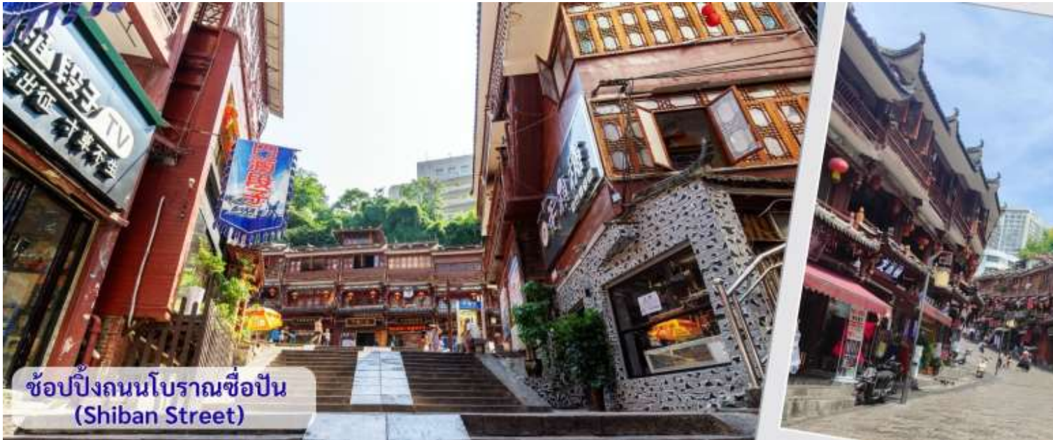
ช้อปปิ้งถนนโบราณช้อปปิ้ง (Shibanshi Street)

จากนั้นนำทุกท่าน เดินถนนโบราณ Feng Hueng Ancient Town ที่ถนนช้อปปิ้ง Shibanshi Street เมืองที่ยังคงรักษาเอกลักษณ์ความเป็นพื้นเมืองผสมผสานกับยุคปัจจุบันเอาไว้ได้อย่างลงตัววิถีชีวิตของชาวบ้านที่อาศัยอยู่ที่นี้ บรรยากาศในเมืองเฟิงหวง ถนนเก่าช้อปปิ้งเป็นถนนปูหินแคบๆ กว้างไม่ถึง 5 เมตร ทอดยาวจากทางเข้าวัดเต้าเหมินไปทางทิศตะวันตก ผ่านถนนหลายสาย ได้แก่ ถนนนครอส ถนนเจิ้งตะวันออก ถนนเจิ้งตะวันตก ศาลาสูยหลง หียงเซียวซง เต้าซ่านลา ศาลาเจียกั๋ว และสุสานเงินฉงเหวิน สุดท้ายจะนำไปสู่ “น้ำพุแรกใต้ฟ้า” ถนนสายนี้มีความยาวกว่า 3,000 เมตร และเป็นย่านการค้าที่คึกคักที่สุดในเฟิงหวง