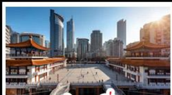
ตักทวยซิ่ง

พระแกะสลักหินต้าจู้ - หลุมฟ้าสะพานสวรรค์ - เจานางฟ้า ตักทวยซิ่ง - ตักตะเกียบ - หมู่บ้านโบราณฉือซีโจว