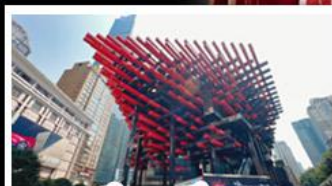
ตักตะเกียบ