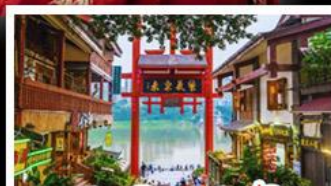
หมู่บ้านโบราณฉือซีโจว