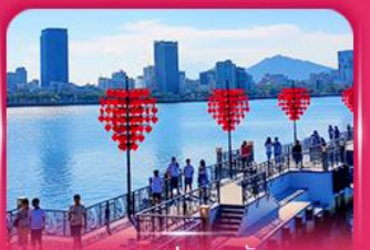
สะพานแห่งความรัก