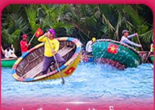
ล่องเรือกระดัง หมู่บ้านกิมทาน