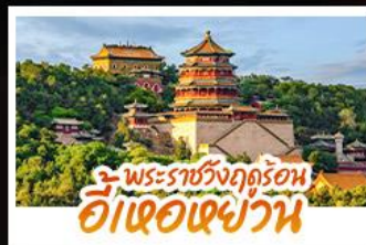
พระราชวังฤดูร้อน ฮี้เอ๋อเซ่ย์วัน