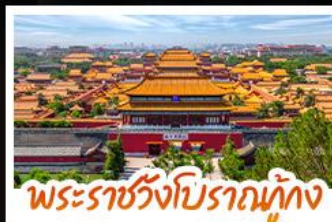
พระราชวังโบราณทุ่ก่ง