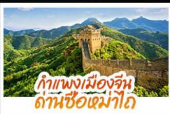
กำแพงเมืองจีน ด่านซือหม่าโต