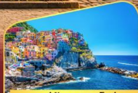
หมู่บ้านมานาโรล่า