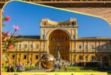
เข้าชมพิพิธภัณฑ์วาติกัน