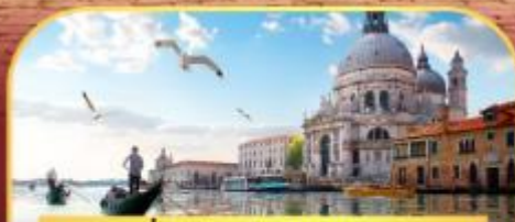
นั่งเรือสุทเกาะเวนิส