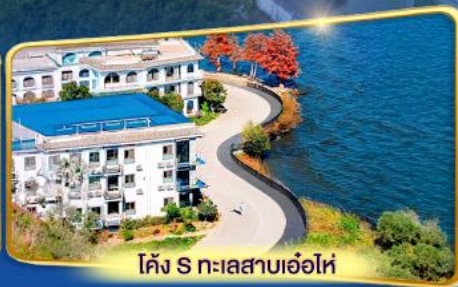
โค้ง S ทะเลสาบเอ๋อไห่