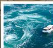
คลองเรือชมน้ำวนมาตุระ

คลองเรือชมน้ำวนมาตุระ / ซุปบึงย่านชินโซบาช / ตลาดปลาคุโรมาง / ซุปบึงย่านอุมาเดะ