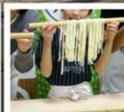
กิจกรรมทำเส้นอุด้ง