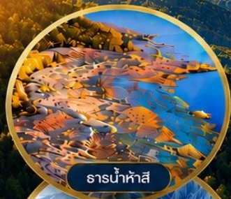
ธารน้ำห้ำสึ