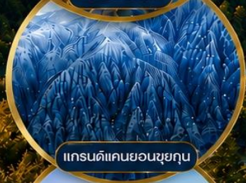
แกรนด์แคนยอนซูยกุน