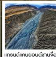
แกรนด์แคนยอนตู้ซานจือ