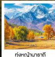
ทุ่งหญ้านาราที

ทัวร์คุณธรรม ไม่ลงร้านช้อปปิ้ง ไม่ขายออฟชั่น