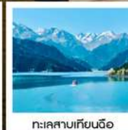
ทะเลสาบเทียนจือ