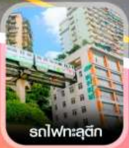
รถไฟทะเลสาบ

คอนเฟิร์มออกเดินทาง ทุกพีเรียด 2 ท่านขึ้นไป