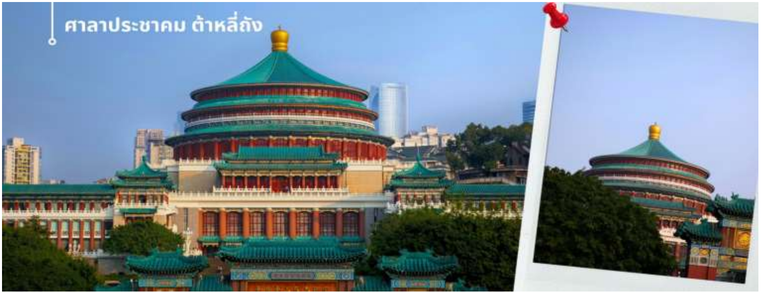
ศาลาประชาชน ต้าหลี่ถิง

นำท่านเดินทางสู่ ศาลาประชาชน (ด้านนอก) เป็นสถานที่หนึ่งในสัญลักษณ์ของเมืองฉงชิ่ง ด้วยสีส้มและรูปแบบการจัดวางอย่างโดดเด่นและลงตัว มีการผสมผสานของศิลปะในยุคราชวงศ์หมิงและราชวงศ์ชิงเข้าไว้ด้วยกัน ด้านหน้าจะเป็นลานกว้างในตอนเย็นและตอนกลางวันจะมีผู้คนจำนวนมากเข้ามารวมตัวกันทำกิจกรรม ไม่ว่าจะเป็นการเต้นแอโรบิก เดินเล่น ปิกนิก เดินชมแสงไฟยามค่ำคืน จัดนิทรรศการต่างๆ