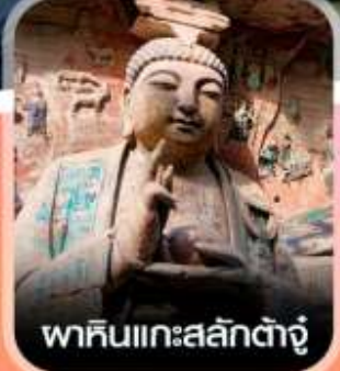
พาคินแกะสลักตัวจู้