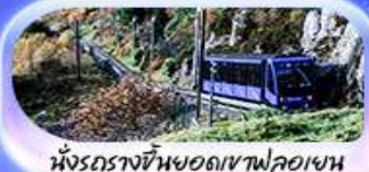
นั้งรถรางขึ้นยอดเขาฟลอม

เปิดประสบการณ์สุดว้าว... สักครั้งในชีวิต! ล่องเรือชมฟยอร์ด นั่งรถไฟสายโรแมนติกฟลอมสพาน่า เบอร์กิน ชมเมืองเก่าบรีกเกน นั่งรถรางขึ้นยอดเขาฟลอยนชวิวเมือง ไมควรฟลาดนั้ง Cable car ขึ้นยอดเขาอูลริเคน ชม Top view ตระการตา ความอลังการระดับมาสเตอร์พีซ จุดชมวิวดัสตาสไนด์ เดินเล่นตลาดปลาเบอร์กิน ขึ้นชมโบสถ์ออส ออสโลเยี่ยมชมโอเปร่าเฮาส์ มหาวิหารออสโล ป้อมปราการอาครส์ฮูส รัฐสภาแห่งนอร์เวย์ สวนอนุชชาติ Vigeland Sculpture Park ซุปป์ิงถนน Karl Johans gate