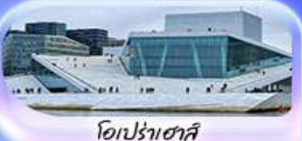
โอเปร่าเฮาส์

07-15 ต.ค.69 / 16-24 ต.ค.69 13-21 พ.ย. 69 / 04-12 ธ.ค. 69 25 ธ.ค. 69 - 02 ม.ค. 70 (ปีใหม่)