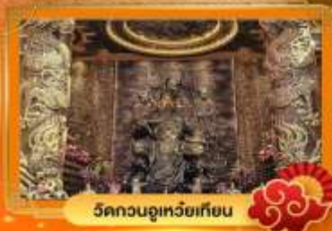
วัดกวนอูเหยี่ยวเทียน