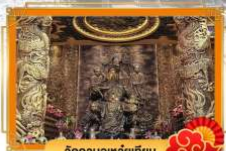
วัดกวนอูเหวยเทียน