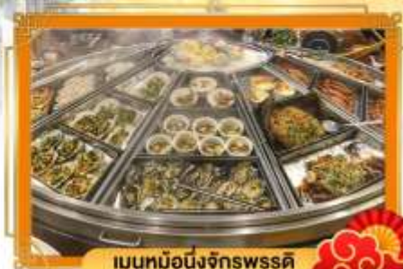
เมนูหม้อนึ่งจักรพรรดิ