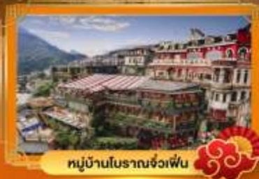
หมู่บ้านโบราณจ่งเฟิน