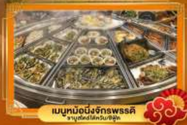
เมนูหม้อนึ่งจักรพรรดิ