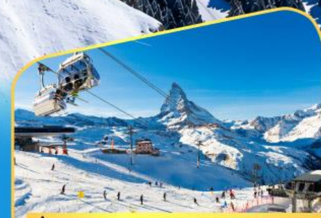
นั่งกระเช้าชมแมทเทอร์ฮอร์น