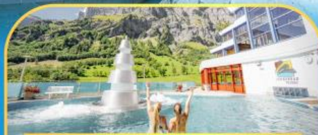
แช่น้ำแร่ร้อนผ่อนคลายลวยคอร์บิค