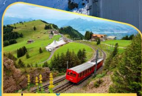
นั่งรถไฟขึ้นสู่ยอดเขาโรทิก