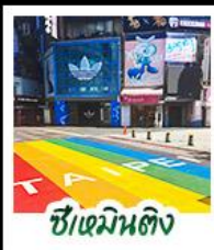
ซีเหมินตง