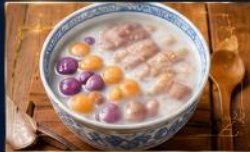
บัวลอยเผือกต้นตำรับ รสชาติหวานนุ่ม อร่อยต้นตำรับ ไม่ควรวลادت

อิสระเดินเล่น ณ หมู่บ้านโบราณจิวเฟิน (Jiufen Old Street) พร้อมลิ้มลองอาหารพื้นเมืองชื่อดัง