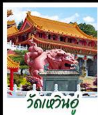
วัดเหวินอู่