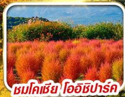
ชมโคเชีย โออิชิปาร์ค