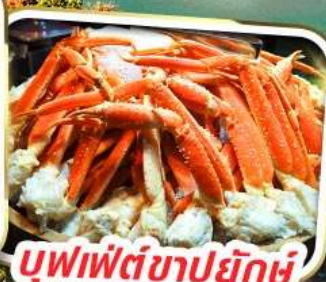
บุฟเฟ่ต์ซาปูยักษ์