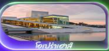
โอเปร่าเฮาส์