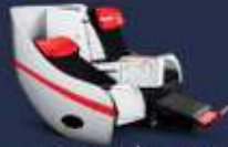
**อัพเดท ณ วันที่ 26/02/67**

Premium Flatbed ที่นอนพิเศษขนาดเตียงกว้าง 19 นิ้ว มีความยาวรถเพียงแถว 59 นิ้ว สามารถรับน้ำหนักได้ถึง 100 กิโลกรัม พร้อมโต๊ะรับประทานอาหาร โต๊ะเขียนจดหมาย และตู้เก็บสัมภาระ