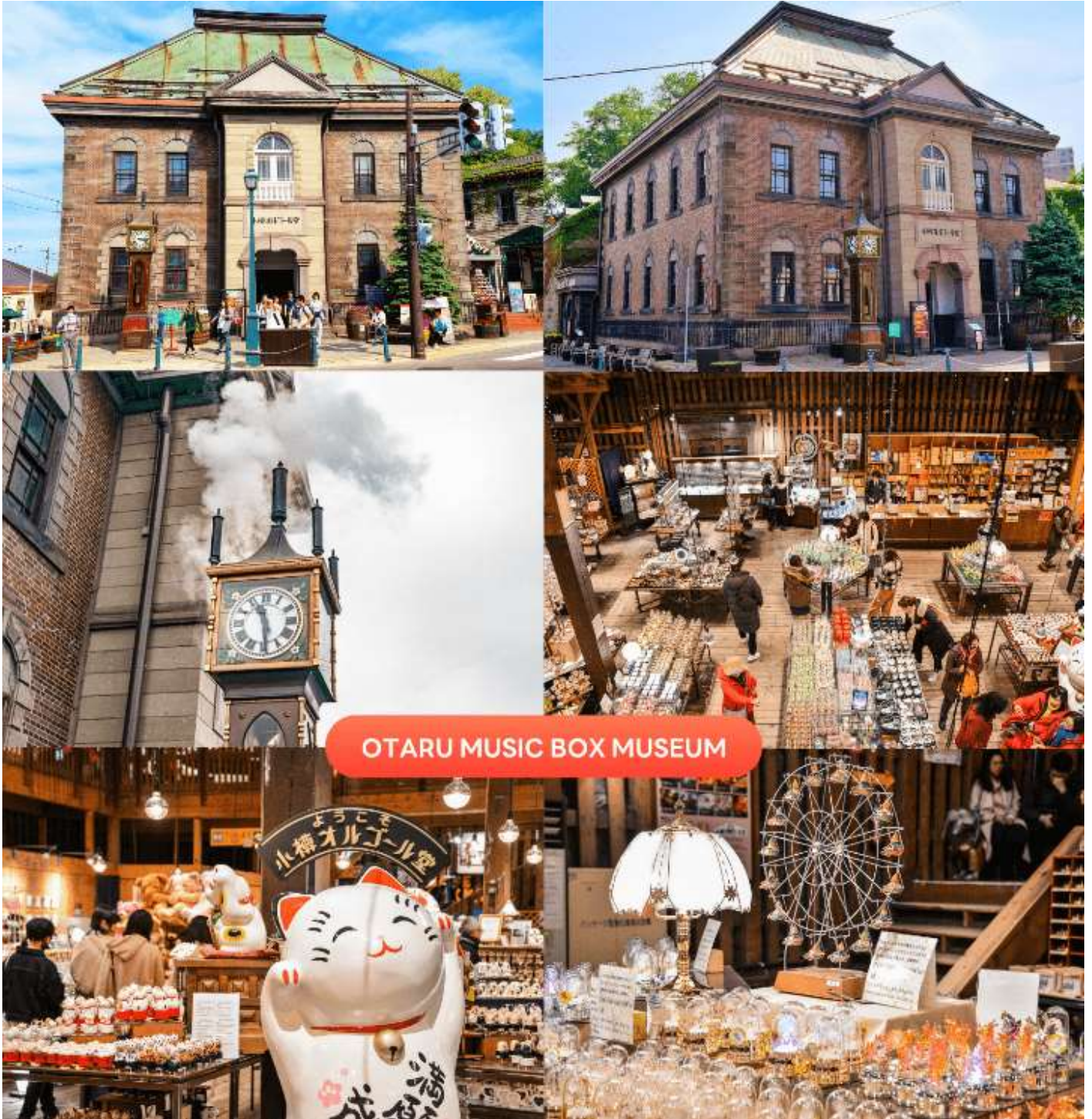
OTARU MUSIC BOX MUSEUM

นำท่านชม พิพิธภัณฑ์กล่องดนตรี (Otaru Music Box Museum) ตั้งอยู่ภายในอาคารเก่าเมืองโอตารุ บริเวณด้านหน้าอาคารมีหอนาฬิกาขนาดใหญ่ที่ทางรัฐบาลแคนาดามอบเป็นของขวัญให้กับรัฐบาลญี่ปุ่น ด้านในอาคารมีกล่องเสียงเพลงมากมาย หลากหลายรูปแบบให้ท่านได้เยี่ยมชม มีการจัดแสดงกล่องดนตรีโบราณและหลากหลายสไตล์กว่า 25,000 ชิ้น อีกทั้งยังมีส่วนจัดแสดงตุ๊กตาดาระกุริ (Karakuri dolls) อันเป็นตุ๊กตาแบบดั้งเดิมของยุคศตวรรษที่ 17 ถึงศตวรรษที่ 19 ที่หาดูได้ยากมาก ๆ ให้ได้ชมอีกด้วย ส่วนใครที่ติดใจอยากได้กล่องดนตรีกลับบ้านแล้วละก็ไม่ต้องเสียใจไป เพราะที่นี่ยังมีส่วนที่เป็นร้านจำหน่ายกล่องดนตรีแบบสั่งทำตามใจจะเอาตุ๊กตาดัวโหนด สืออะไร เพลงอะไร สั่งได้ไว้เป็นของที่ระลึก แบบไม่เหมือนใครกันอีกด้วย