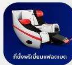
ที่นั่งพรีเมียมแพลตตินัม