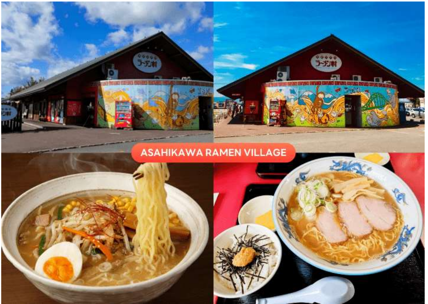
ASAHIKAWA RAMEN VILLAGE

นำท่านเดินทางกลับสู่ เมืองอาซาฮิดาว่า (Asahikawa) เพื่อนำท่านสู่ หมู่บ้านราเมนอาซาฮิดาว่า (Asahikawa Ramen Village) แหล่งรวมราเมนเจ้าดังของเมืองอาซาฮิดาว่า ที่คัดสรรร้านยอดนิยมไว้ถึง 8 ร้านในที่เดียว เพลิดเพลินกับการลิ้มลองราเมนสูตรต้นตำรับฮอกไกโด สไตล์ซูโงยุที่ขึ้นชื่อเรื่องความหอมกลมกล่อม พร้อมเลือกชิมแต่ละร้านได้ตามใจ อีกทั้งยังมีโซนขายของที่ระลึก และพิพิธภัณฑ์เล็ก ๆ ให้ได้เรียนรู้ประวัติราเมนอีกด้วย