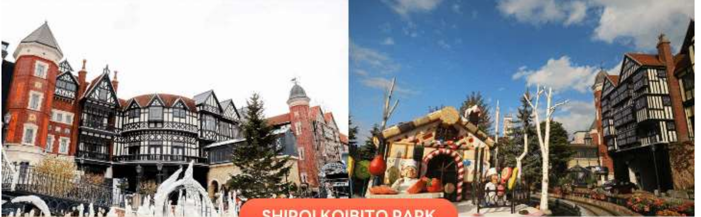
SHIROI KOIBITO PARK