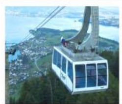
ขึ้นกระเช้ายอดเขาริกิ