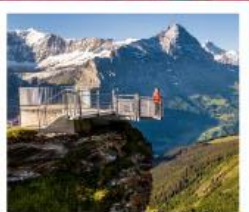
กรีนเดลวาลด์เฟียส