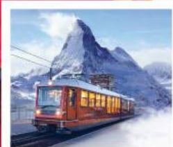
รถไฟเขารอนเนอร์เกรต