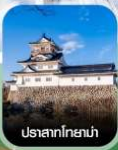
ปราสาทโทยาม่า