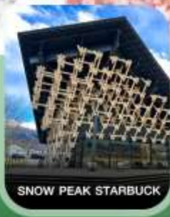
SNOW PEAK STARBUCK