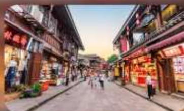
หมู่บ้านโบราณฉือซีไห่