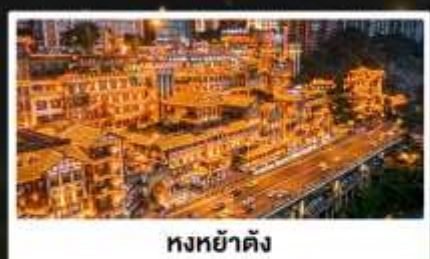
หงหย่าต้ง