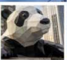
ห้าง IFS หมีแพนด้าเป็นตึก