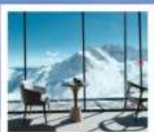
4860 COFFEE SHOP