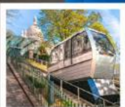
ขึ้นรถรางสู่มงมาร์ต