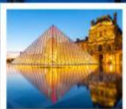
ถ่ายรูปพีพีอาร์กันที่ลูฟร์