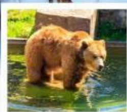
บ่อน้ำเมืองเบิร์น