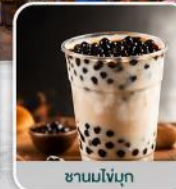
ชาวมโซบุก