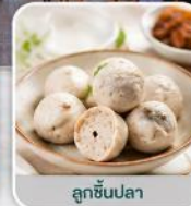
ลูกชิ้นปลา