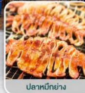
ปลาหมึกย่าง