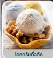
ไอศกรีมถั่วตัด