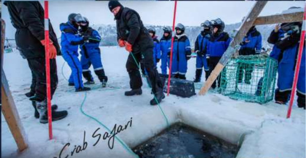
King Crab Safari