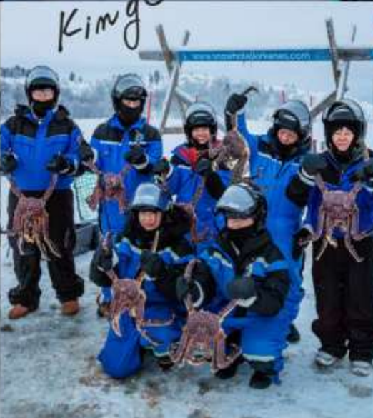
King Crab Safari