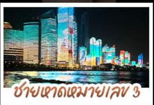
ช่างเขาดเมมาฯ เลข 3