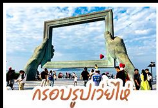
กรอบรูปเว่ยไห่

ทำรูปย่านเมืองเก่าสไตลียอร์มัน • โบสถ์ซันติไมเคิล และย่านป่าดึกทวน พร้อมทัวร์พิพิธภัณฑ์โรงเบียร์ชิงเต่าระดับตำนาน ฟรี! ซิมเนียร์สกด่านละ 1 แก้ว เซ็คอินมูนมหาสมบัติเมื่อก่อนคอบเพลิงสายที่ 8 • แวะทำรูปสคูอาร์ตกับ ซากเรือลู่เว่ย • ตกค่ำดูของกันที่ตลาดสไตลียอร์มัน ถนนอันลือฉาว เที่ยวอิสระ-ตามใจชอบ จัดสรรเวลาให้ท่านด้วยวัน FREE DAY 1 วันเต็มในชิงเต่า