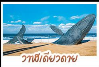
วาฬยัดขวดดาช