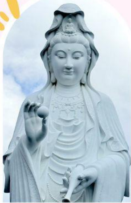
วัดเจ้าแม่กวนอิมซี้ซัน ความเมตตา ความสงบ สิริมงคล