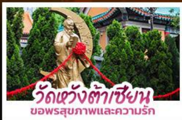
วัดเซ่งเต้าเซียง ขอพรสุขภาพและความรัก

ขอพรเจ้าแม่กวนอิมวัดซีซ่าน ที่สูงเป็นอันดับ 2 ของโลก นั่งกระเช้าเองปีงสักการะพระใหญ่เทียนถาน • ขอพรองค์แซง โชคลาภ การเงินและธุรกิจ • ซ็อบปีงจุ้ยย่านจิมซาจุ้ย และ CITYGATE OUTLETS