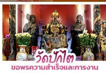
วัดบักโต ขอพรความสำเร็จและการทำงาน