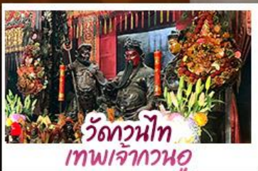
วัดกวนไท เทพเจ้ากวนอู