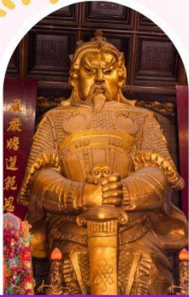
วัดเซกกง ขอพรโชคลาก การเงิน และธุรกิจ

"ไหว้พระ เสริมดวง เพิ่มสิริมงคลแก่ชีวิต"