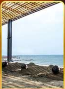
ออนเซ็นร้อน