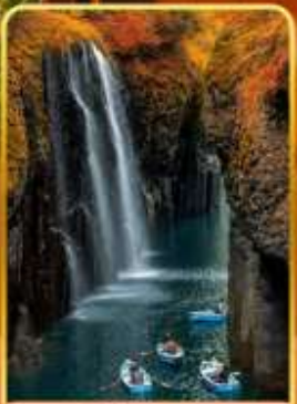
ทาคาจิโอะ(ไม่รวมสองเรือ)