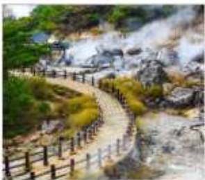
หุบเขานรกอุเนเซ็น