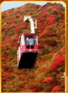
กระเช้าลอยฟ้าอุเนเซน