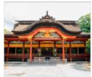
ศาลเจ้าดาไซฟู