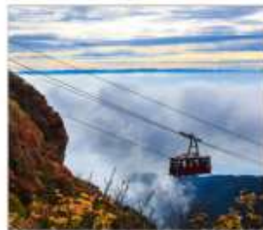
นั่งกระเช้าลอยฟ้าอุเนเซ็น