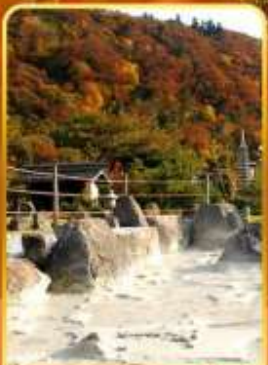
หุบเขานรกอุเนเซน