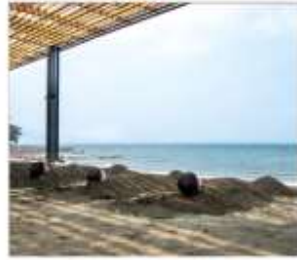
อามทรายร้อย