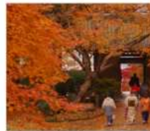
วัดไดโดเซนจิ