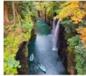
หุบเขาทาดางิโฮะ