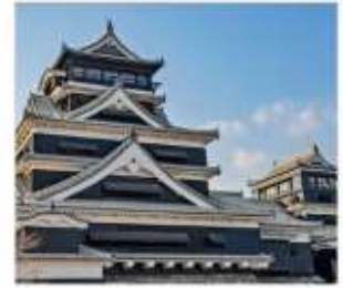
ปราสาทคามาโมตะ