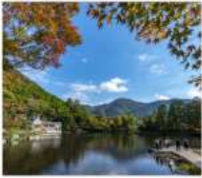
ยูฟูจิน (ทะเลสาบคีริน)