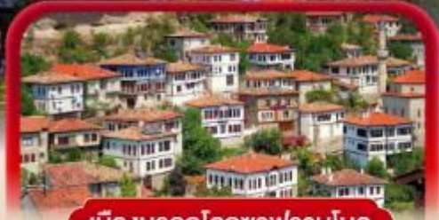
เมืองมรดกโลกซาฟรานโบลู