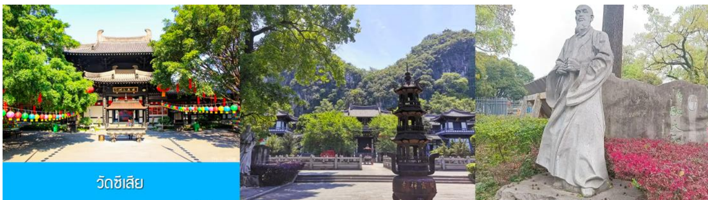
วัดซีเสียน

หลังอาหารนำท่านเที่ยวชม สวนเจ็ดดาว 七星公园 (รวมค่าตั๋วเข้าชมและค่ารถอล์ฟแล้ว) เป็นสวนสาธารณะที่ใหญ่ที่สุดและสวยงามที่สุดในเมืองกุ้ยหลิน ตั้งอยู่ทางด้านตะวันออกของแม่น้ำหลีเจียงมีชื่อเสียงในเรื่อง ภูเขาเขียว น้ำสวย ถ้ำแปลก และหินงาม ภายในอุทยานมีอาณาเขตครอบคลุมพื้นที่เนินเขา 7 ลูก ที่เรียงกันเหมือนกลุ่มดาวหมีใหญ่ ภายในมีสถาปัตยกรรมจีน โบราณตั้งเรียงรายและพืชพันธุ์มากมายให้ท่านได้เพลิดเพลินกับหุบเขาอันเขียวสงบ ชมความสวยงามของ ถ้ำเจ็ดดาว 七星岩 ที่ภายในเต็มไปด้วยหินงอกหินย้อยและเสาหินที่เกิดจากการหลอมละลายของหินปูน ชม เขาอูฐ 骆驼山 ภูเขารูปร่างคล้ายหลังอูฐนี้เกิดจากการดันตัวของเปลือกโลก เดิมเรียกว่าเขาจอกสุรา แต่เดิมในอดีตนั้นสถานที่แห่งนี้เคยเป็นที่ปลีกวิเวกของเหล่านักปราชญ์แล้วเขาอูฐนี้ก็ได้อกลายเป็น สัญลักษณ์ทางภูมิทัศน์ของกุ้ยหลินอีกด้วย