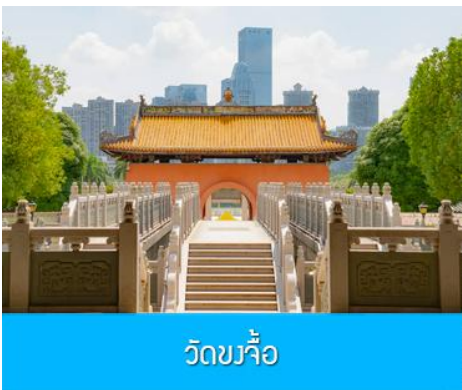
วัดขงจื้อ

เช้า บริการอาหารเช้า ณ ร้านอาหารในโรงแรม (8)