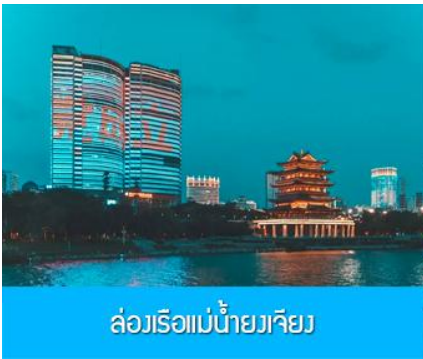
ล่องเรือแม่น้ำยวเจียง