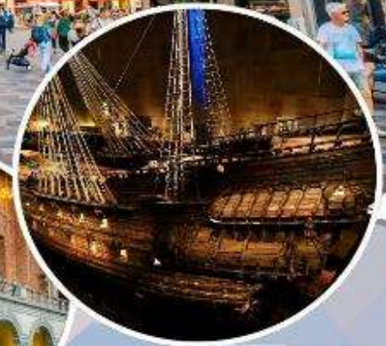
เข้าชม "พิพิธภัณฑ์เรือวาซา"