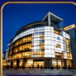
The Ring Mall