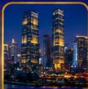
ตึกโค่วซิงไห่