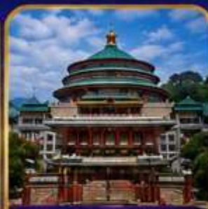
มหาศาลาประชาชนฉงชิ่ง