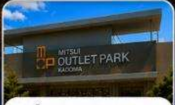
ช้อปปิ้ง MITSUI OUTLET KADOMA