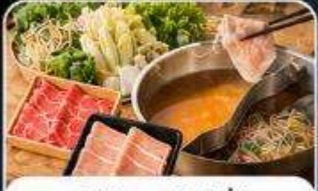
บุฟเฟ่ต์ซาบุสโตลล์ญี่ปุ่น

เดินทาง : 19 - 23 ส.ค. 04 - 08 , 16 - 20 ก.ย. 69