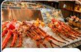
ตลาดปลาคุโรเมง