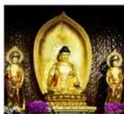
วัดต้าฉีอ

ทัวร์คุณภาพ ไม่หลงร้านช้อปปิ้ง ไม่ขายออฟชั่น