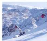
ภูเขาหิมะ-ต้ากู่ปิงชว่น